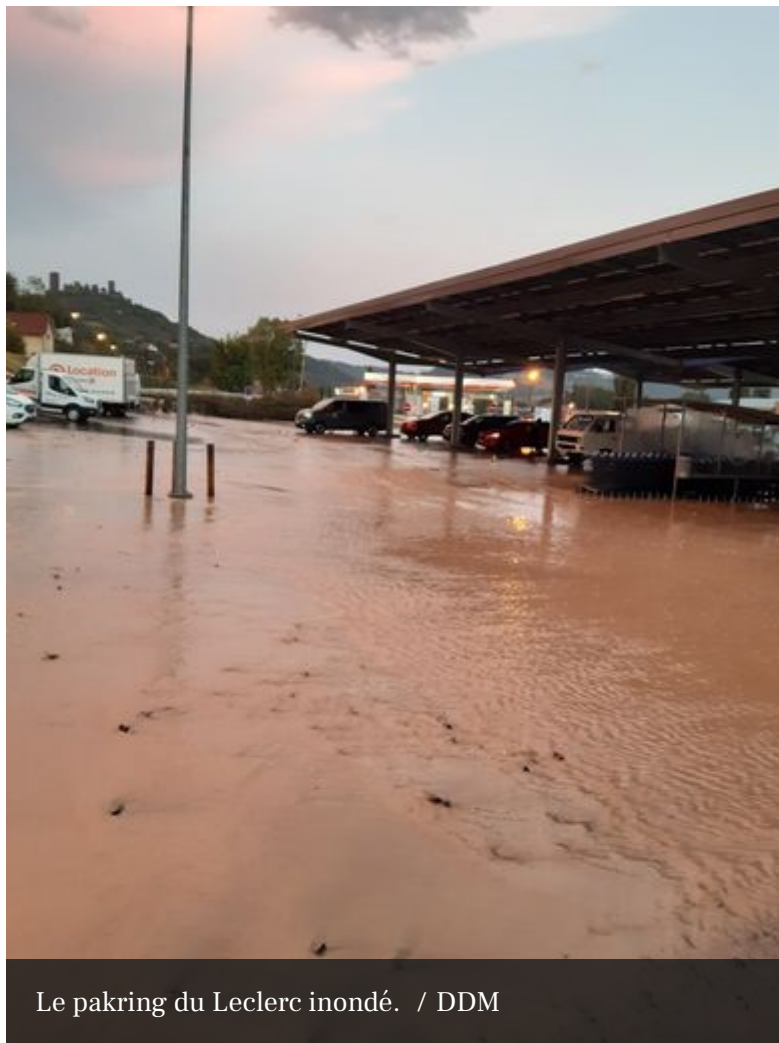
Le parking du Leclerc inondé.