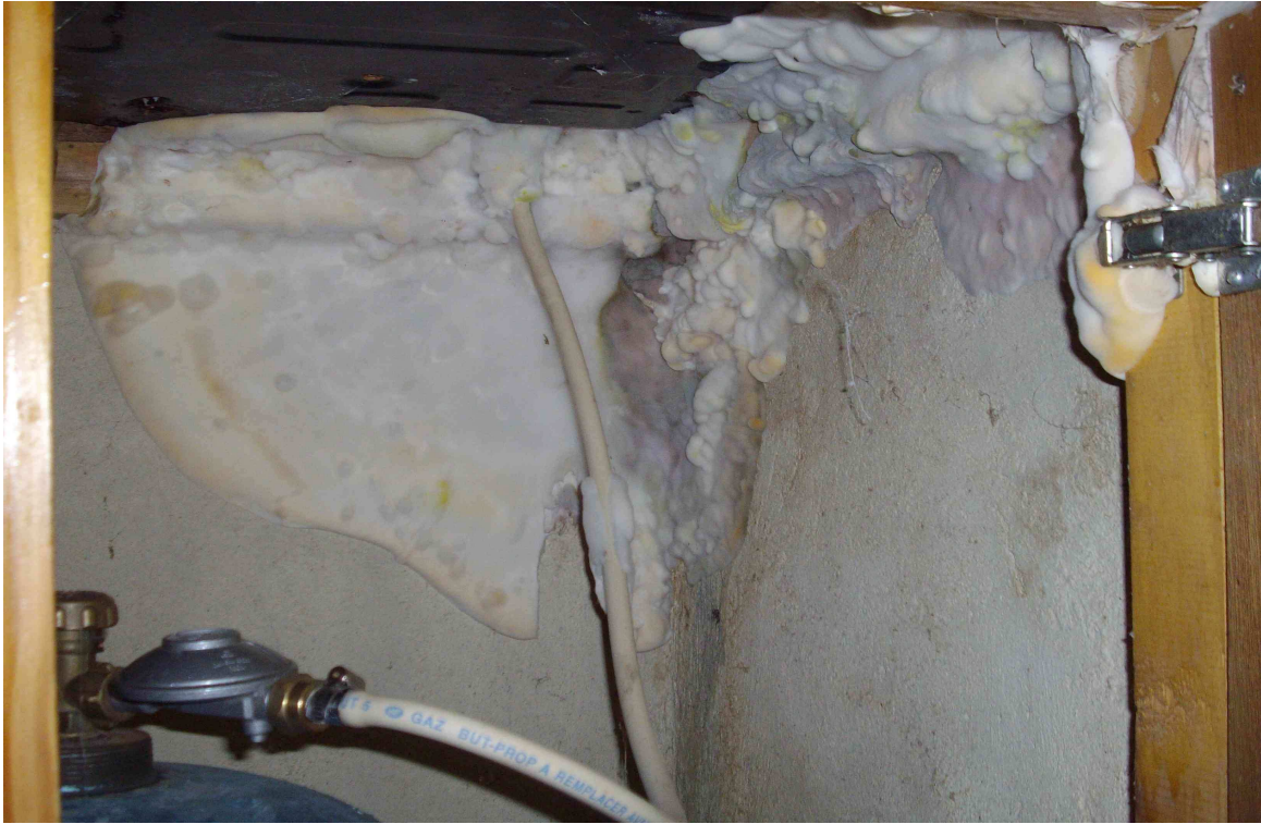
Mérule développée dans le placard d'un évier