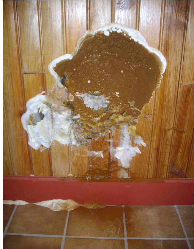
Mérule qui s'est développée sur le lambris d'habillage du mur contre lequel était placée l'armoire