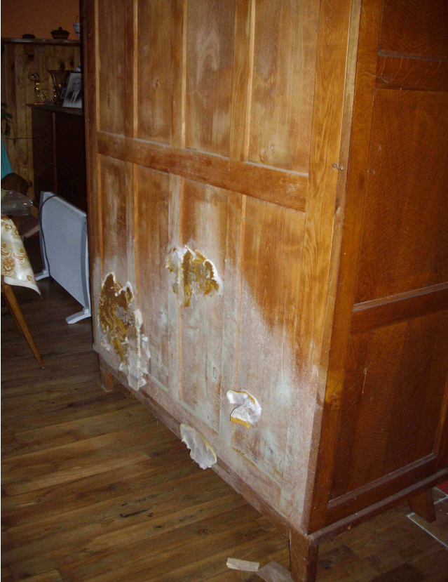
Mérule qui s'est développée derrière une armoire plaquée contre un mur