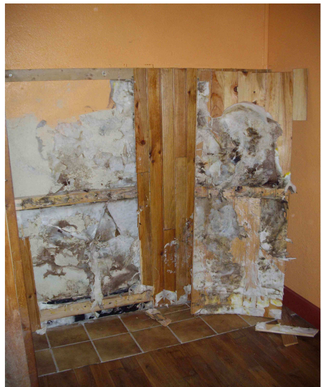
Mérule qui s'est développée entre le lambris et le mur humide