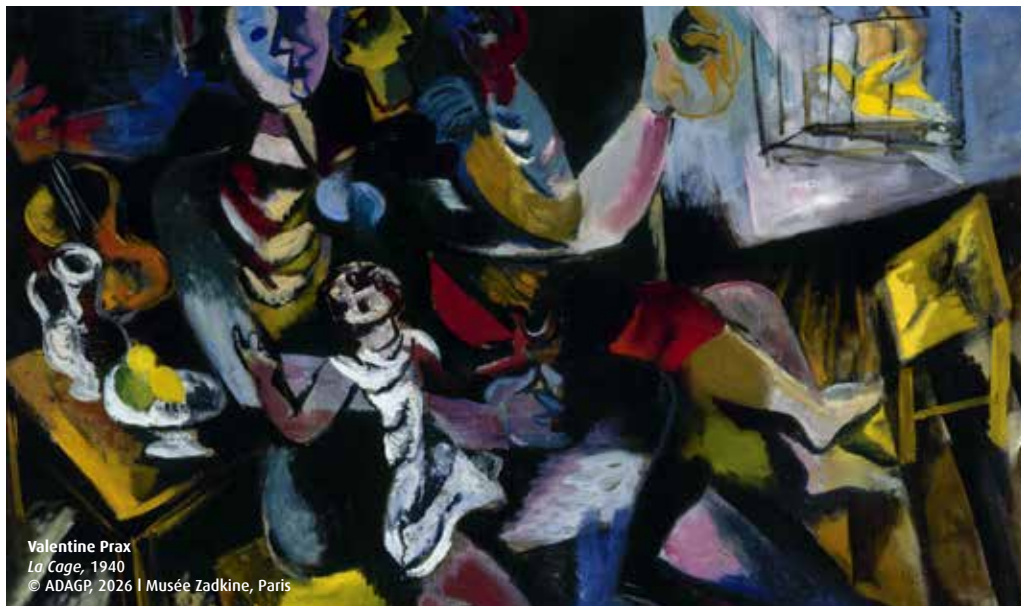
Valentine Prax La Cage, 1940 © ADAGP, 2026 | Musée Zadkine, Paris