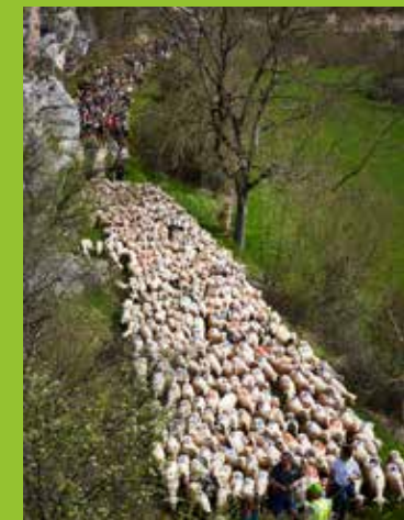
Pastoralisme