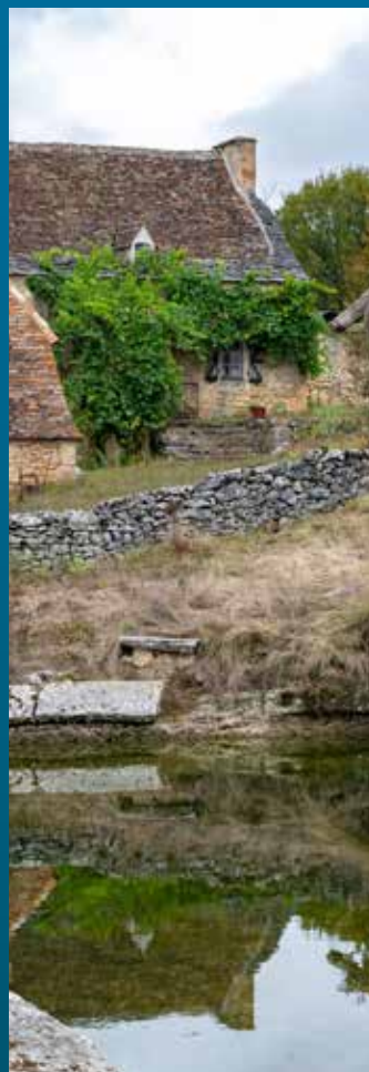
ÉCOMUSÉE DE CUZALS